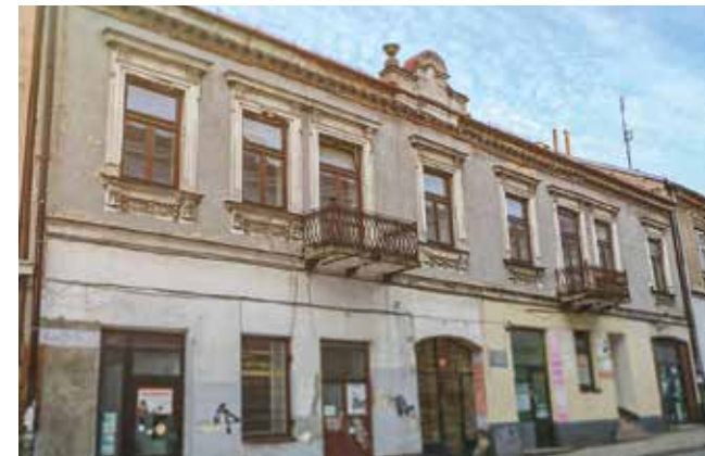
— Pierwsza siedziba KPT przy ul. Piotrkowskiej

– Jedno jest pewne, udało nam się zretencjonować wodę na niespotykaną wówczas skalę. W ziemi znajduje się mnóstwo skrzynek, które zbierają jej nadmiar – zapewnia dyrektor KPT. Budowa Inkubatora Orange Inc. oraz Centrum Technologicznego KPT zapoczątkowała inwestycje, które w ciągu zaledwie kilku lat zmieniły przemysłowe i zapomniane tereny w tętniącą życiem