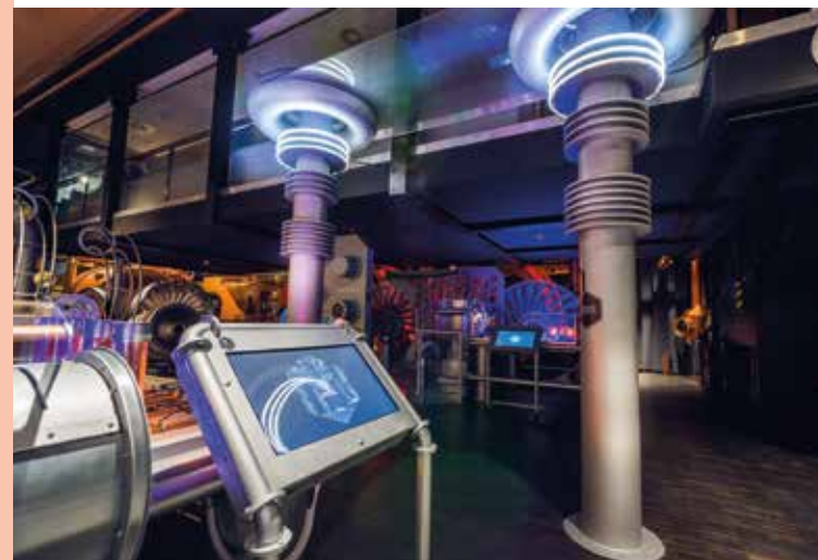
Energetyczne Centrum Nauki