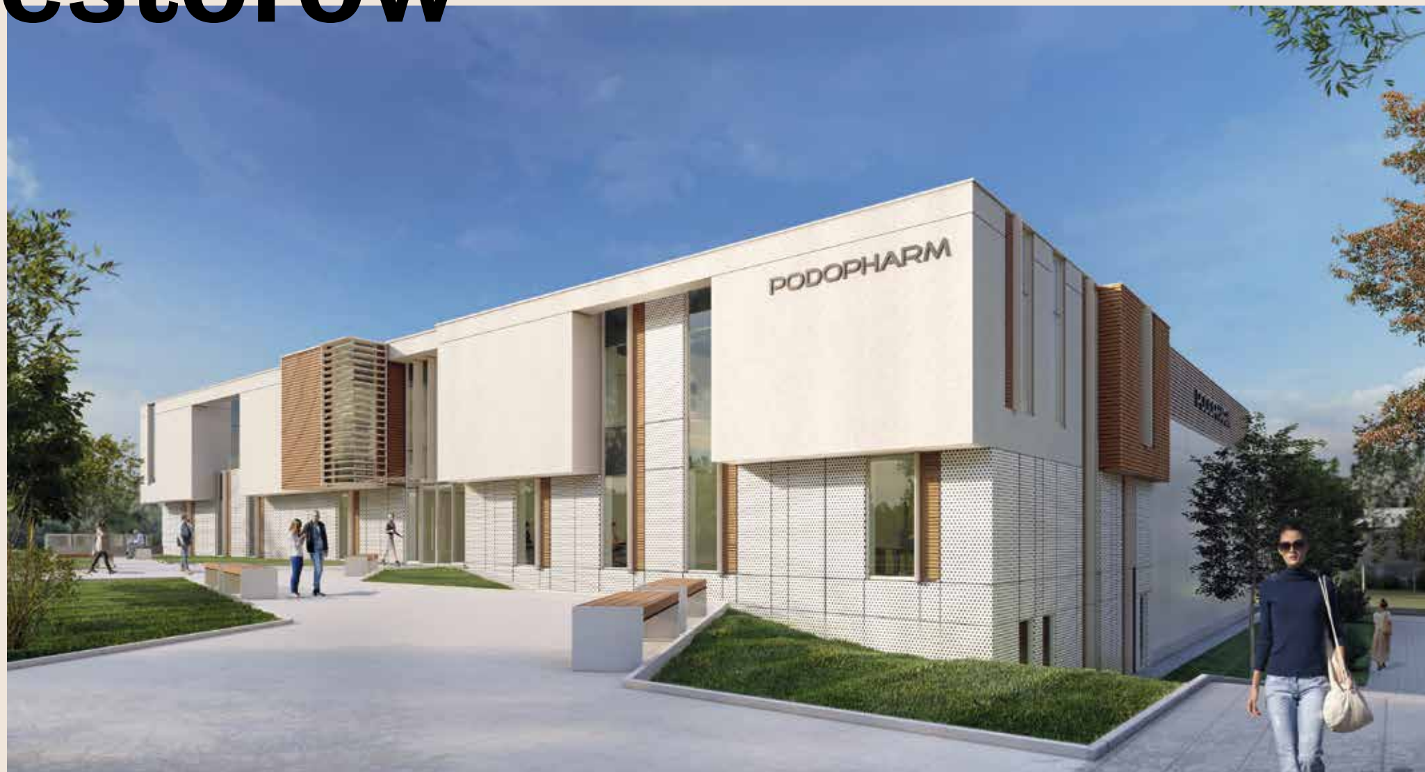
—Wizualizacja nowej siedziby PODOPHARM®

W pełni uzbrojone przez Park tereny inwestycyjne to atrakcyjna przestrzeń dla biznesu. Wiedzą o tym firmy, które wyrosły z inkubatorów oraz Centrum Technologicznego KPT. Zakup działek przy ul. Olszewskiego i zbudowanie własnych zakładów dla wielu z nich jest naturalnym etapem rozwoju.