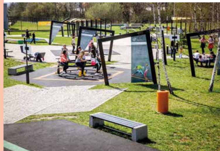
Energetyczny Ogród Doświadczeń