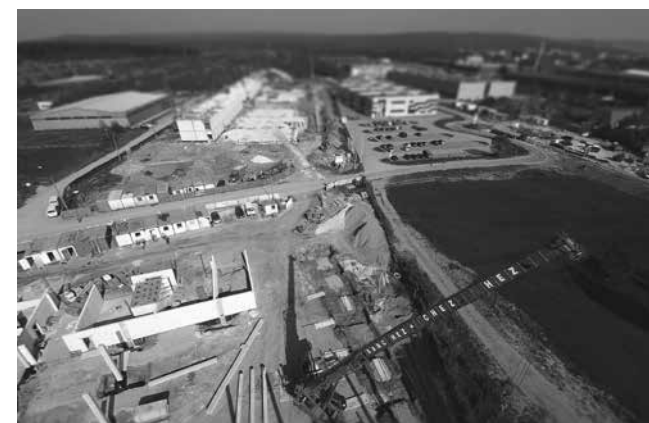
— Budowa Centrum Technologicznego KPT

dzielnice biznesową. Dziś KPT to nowoczesna infrastruktura – inkubatory Skye i Orange, Centrum Technologiczne z halami produkcyjnymi: Singapur, Yuyao i Recife oraz obiektami biurowo-laboratoryjnymi Roma i Oulu, a także Inkubator Logistyczny Rotterdam. Do tego 15 ha terenów inwestycyjnych, w większości już zagospodarowanych, parkingi oraz Energetyczny Ogród Doświadczeń. Ulica Olszewskiego to dziś najlepszy adres w mieście. ■