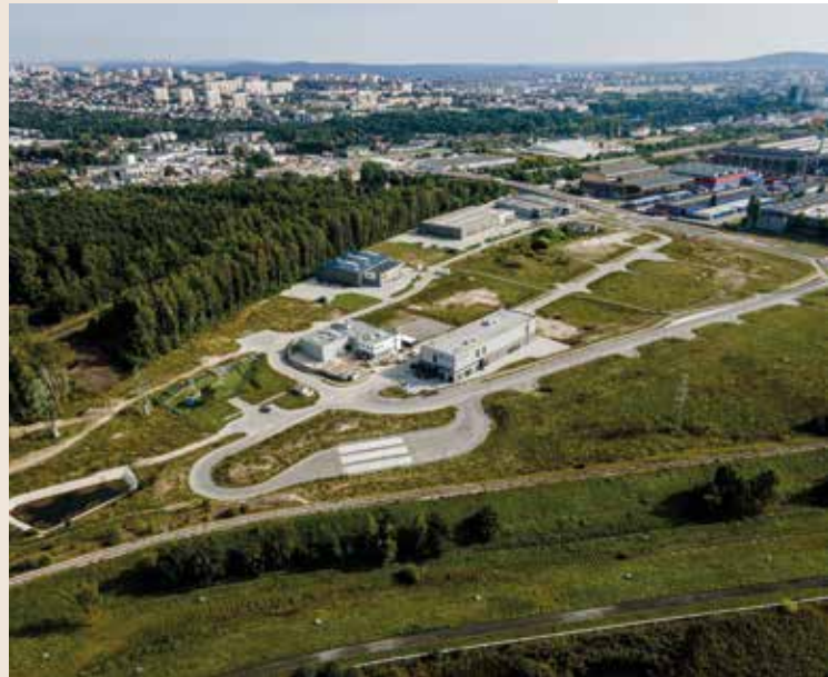
—Tereny inwestycyjne uzbrojone przez KPT

– Kielce są miastem atrakcyjnym dla przedsiębiorców – nie ma wątpliwości dyrektor KPT. – Przy współpracy z Centrum Obsługi Inwestora zrobimy wszystko, by przyciągnąć tu każdego inwestora i by mu pomóc w dalszym rozwoju. Budowa Californii Inc. to dodatkowy atut w rękach miasta.