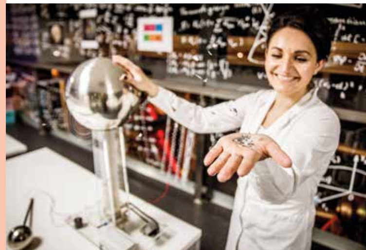
Kreatywne warsztaty w Energetycznym Centrum Nauki