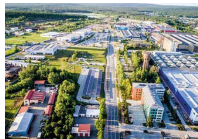
— Infrastruktura KPT obecnie

dzielnice biznesową. Dziś KPT to nowoczesna infrastruktura – inkubatory Skye i Orange, Centrum Technologiczne z halami produkcyjnymi: Singapur, Yuyao i Recife oraz obiektami biurowo-laboratoryjnymi Roma i Oulu, a także Inkubator Logistyczny Rotterdam. Do tego 15 ha terenów inwestycyjnych, w większości już zagospodarowanych, parkingi oraz Energetyczny Ogród Doświadczeń. Ulica Olszewskiego to dziś najlepszy adres w mieście. ■