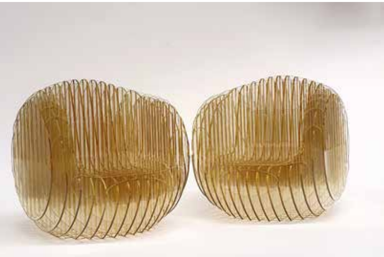
Design Form Studio